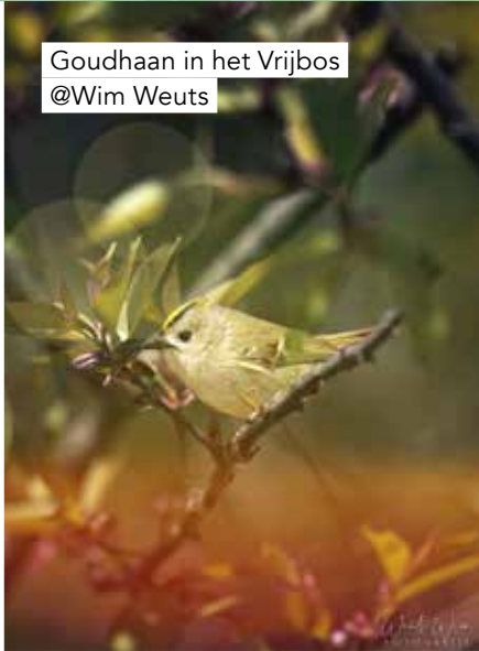
Goudhaan in het Vrijbos