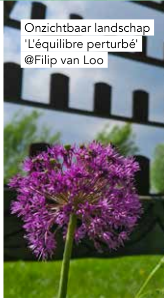
Onzichtbaar landschap 'L'équilibre perturbé' @Filip van Loo