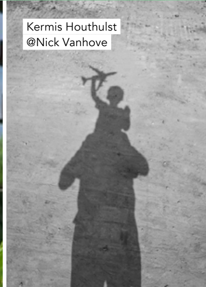
Kermis Houthulst