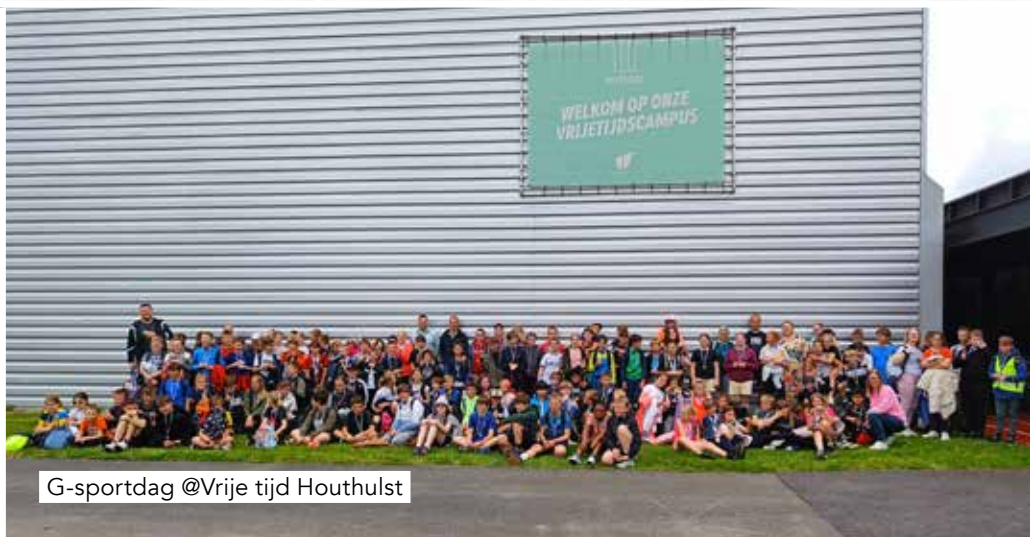
G-sportdag @Vrije tijd Houthulst