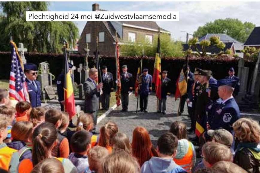
Plechtigheid 24 mei @Zuidwestvlaamsemedia