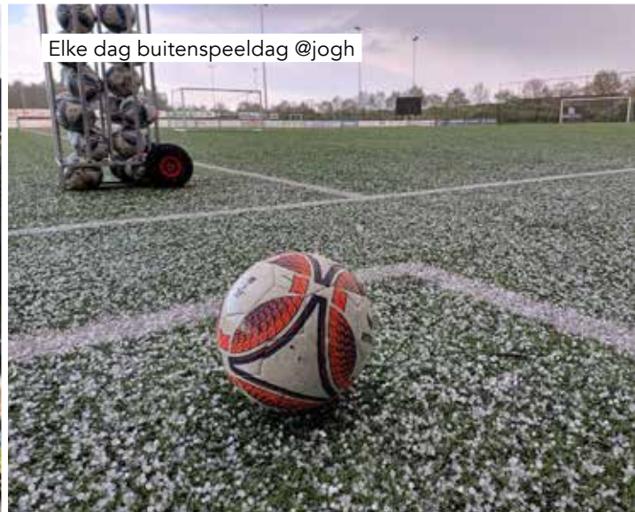
Elke dag buitenspeeldag @jogh