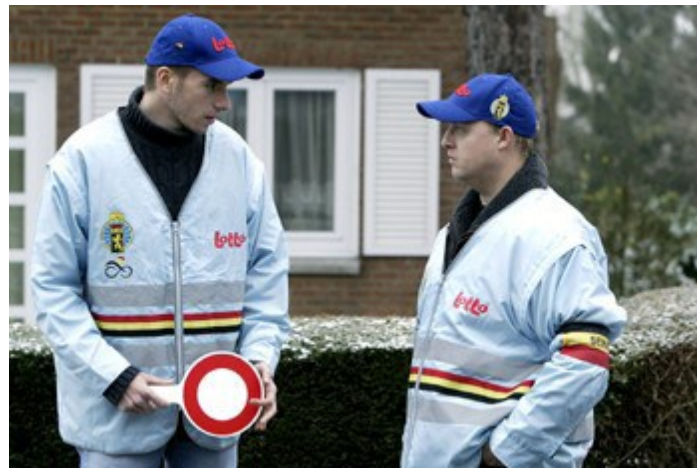
4.1. Taakbeschrijving van de seingever: